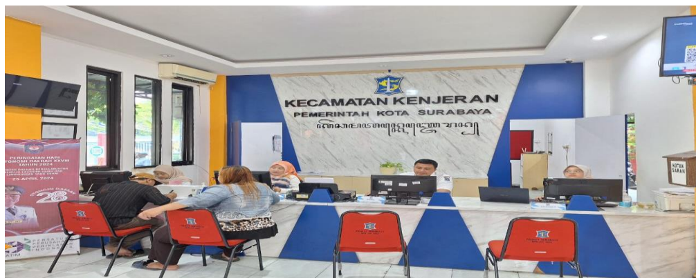
Gambar 1 Proses Komunikasi Pegawai Pelayanan Kecamatan Kenjeran

Komunikasi dalam sebuah kebijakan berkaitan dengan kejelasan informasi yang dipahami terkait dengan kebijakan. Kebijakan tersebut tentu harus memiliki informasi dan tujuan yang jelas sehingga masyarakat dapat merasakan hasilnya. Komunikasi ini berkaitan erat dengan pelaksanaan identitas kependudukan digital baik yang harus dilakukan dengan jelas dan konsisten. Komunikasi yang dilajankan kecamatan kenjeran dalam pelaksanaan identitas kependudukan digital bersifat terbuka. Dimana memberikan informasi secara langsung kepada masyarakat apabila belum mengerti tentang identitas kependudukan digital.