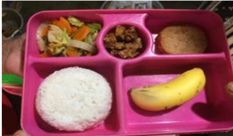
Gambar 1. Menu Permakanan